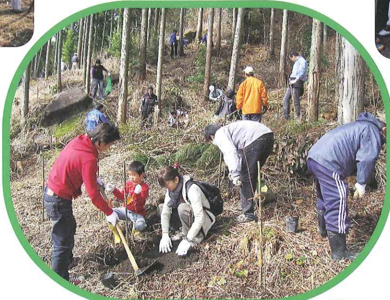
「森林ボランティアの日」の植樹活動(県民の森)