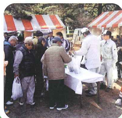
緑化木無償配布(日出町)