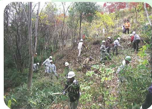
ボランティアによる下刈り作業(県民の森)