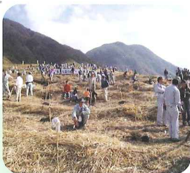
豊かな国の森づくり大会(由布市)